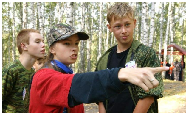
7б определяет азимут