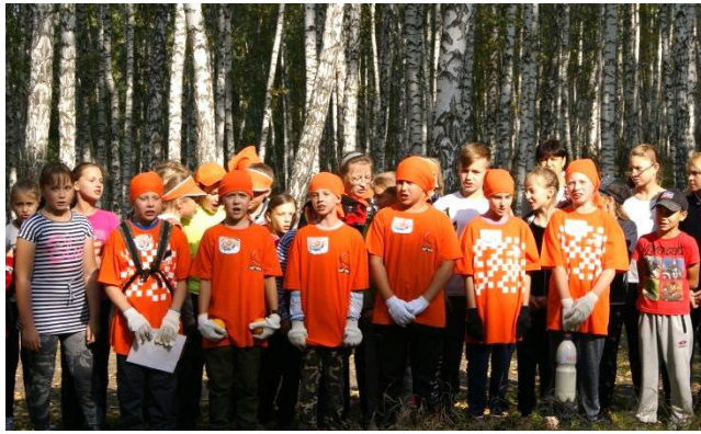
Команда 5б класса

Итак, наступает волнительный момент, дан старт командам пеших туристов.