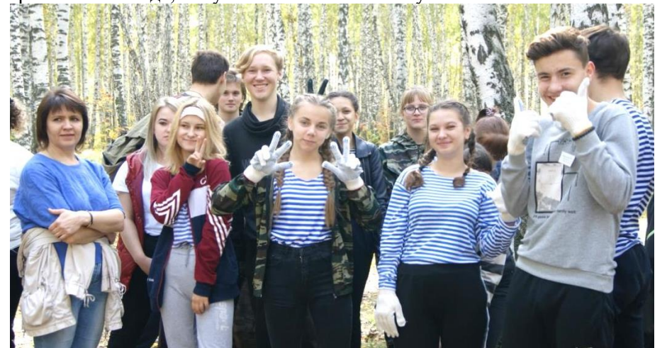
Очень позитивная команда 9а класса

- Этот турслет я буду долго помнить из-за нашей довольно скромной, но при этом не менее вкусной сервировки. Ни для кого не секрет, что на свежем воздухе аппетит приходит в разы быстрее. Поэтому даже привычные блюда, могут казаться намного вкуснее.