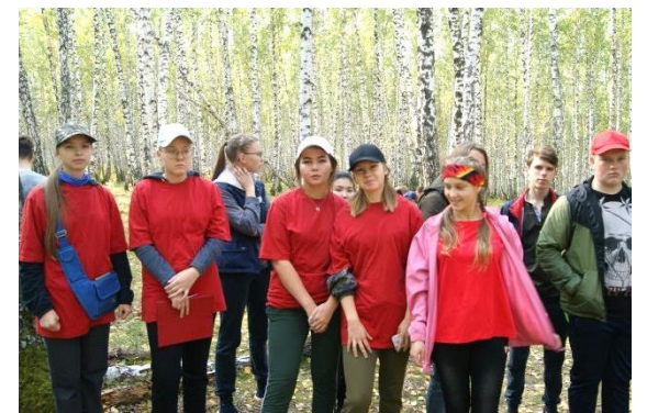
Сборная 10-11 классов