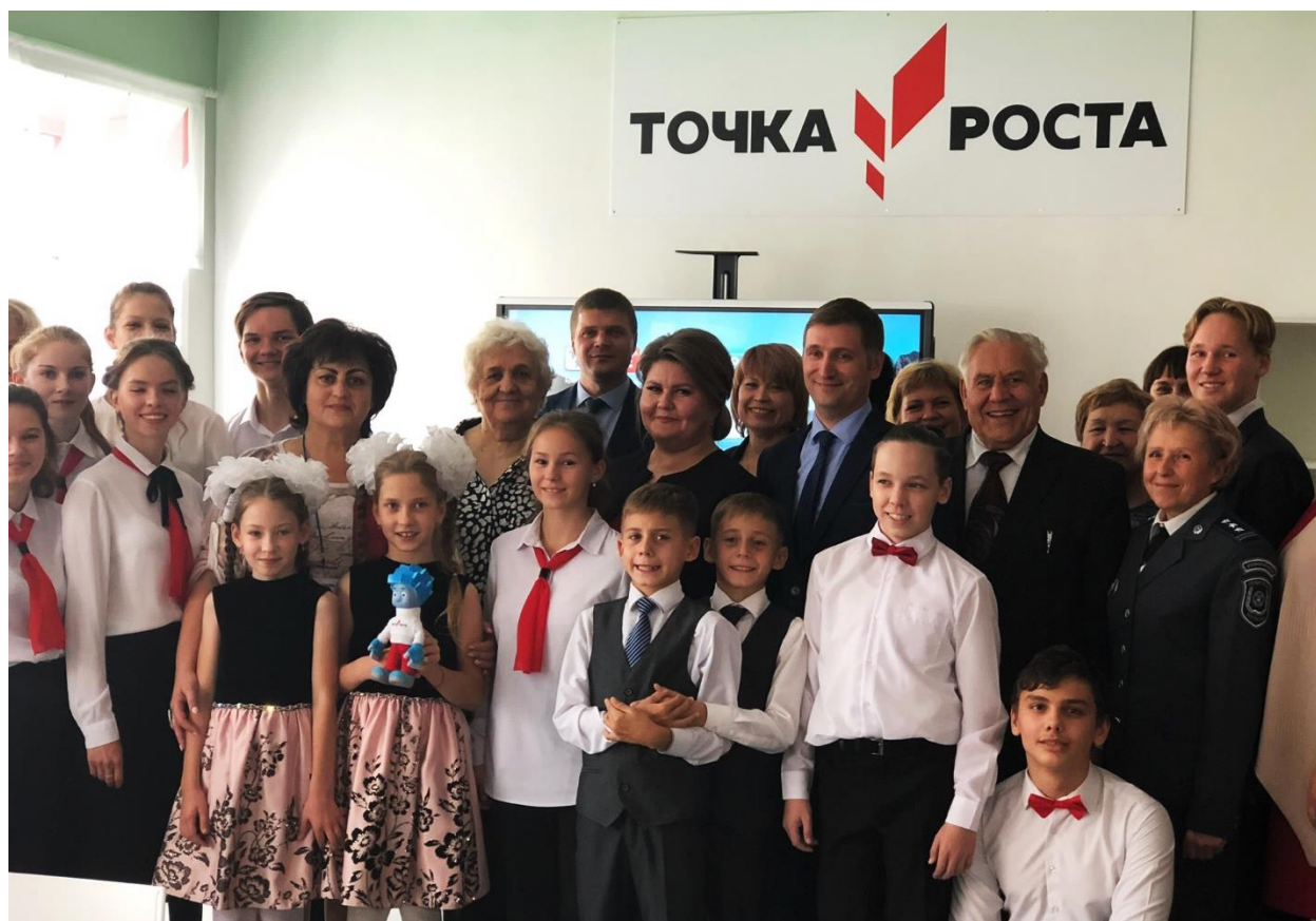
Почетные гости и участники торжественного открытия центра образования цифрового и гуманитарного профилей «Точка роста» на базе нашей школы