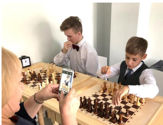
Первые шахматные поединки