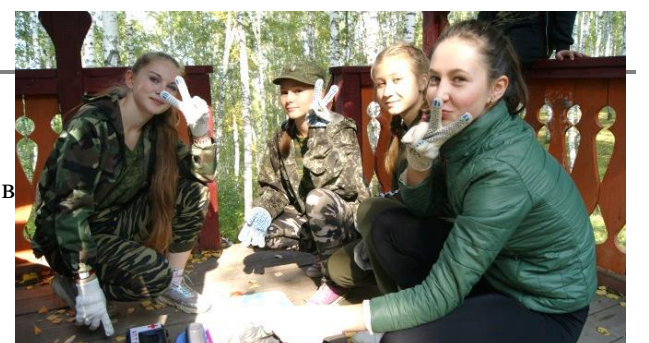
Прохождение этапа «сборка рюкзака» команда 8б класса